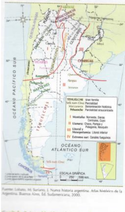
GRUPOS ÉTNICOS EN EL TERRITORIO ARGENTINO (SIGLO XVI)