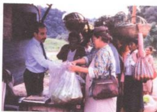
Control aduanero entre Yacuiba (Bolivia) y Salvador Mazza (Argentina).

El censo de 1914 registró el porcentaje más alto de extranjeros de toda la historia argentina (30%). Entre 1914 y 1947 disminuyó la inmigración europea hacia la Argentina por la gran crisis económica mundial desatada a partir de 1929 y porque en la Argentina ya no se requerían grandes montos de mano de obra agrícola.